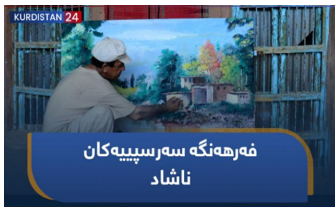
دۆکیۆمینتاری ژماره (9)