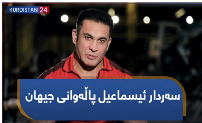
دۆکیۆمێنتاری ژمارە (4)

ناونیشانەکانی بەرنامەی دۆکیۆمێنتاری، وەک سامپلی توێژینەوهکە خراوەتە روو: