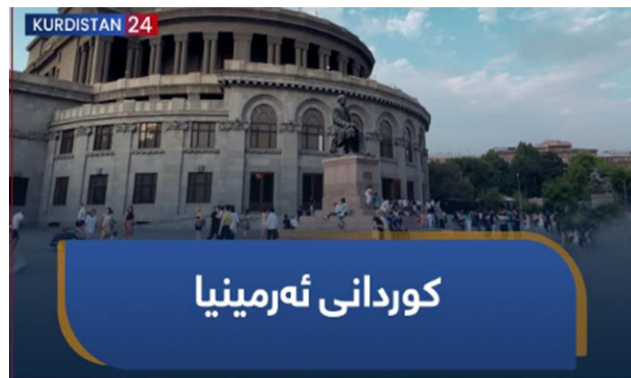
دۆکیۆمێنتاری ژمارە (5)