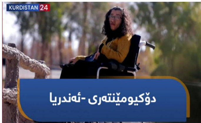
دۆکیۆمێنتاری ژمارە (2)