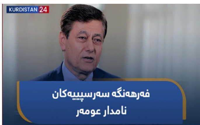
دۆکیۆمینتاری ژماره (7)