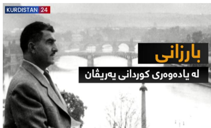
دۆکیۆمینتاری ژماره (8)