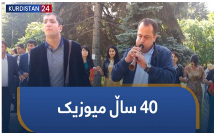
دۆکیۆمێنتاری ژمارە (1)