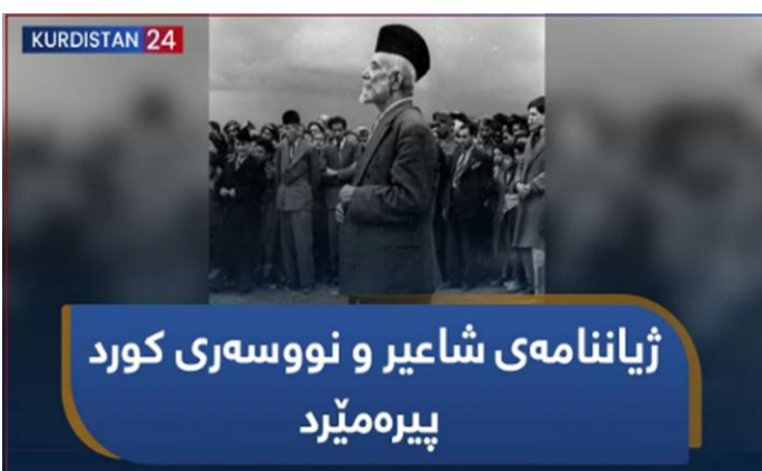
دۆکیۆمینتاری ژماره (12)