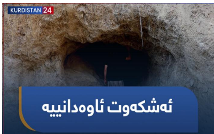
دۆکیۆمێنتاری ژمارە (3)