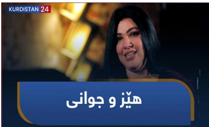
دۆکیۆمینتاری ژماره (11)