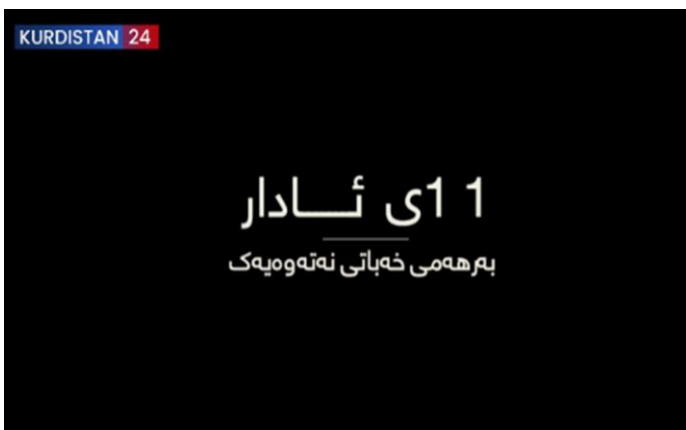
دۆکیۆمینتاری ژماره (10)