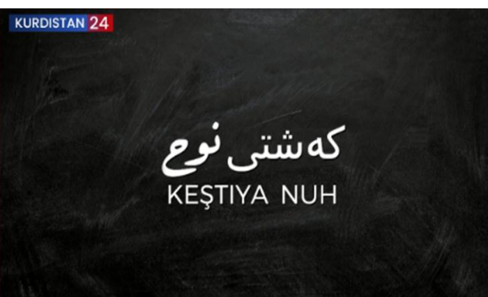
دۆکیۆمێنتاری ژمارە (6)